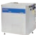
SH SOLAR D