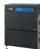
SC DUO 7P