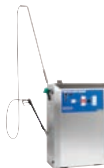
SH AUTO 5M