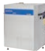
SH SOLAR G