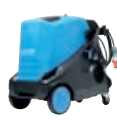
MH 5M E