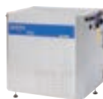
SH SOLAR E