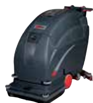
FANG24T / 26T / 28T